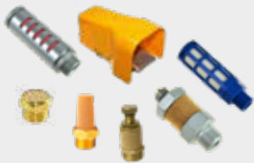
Acessórios para Válvulas