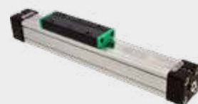
Cilindros Sem Haste Série PLF