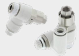
Válvula Retenção Pilotada C/ Regulagem de Fluxo Série WASP