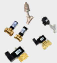
Válvulas de Processo