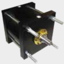
Cilindros Extra Grandes