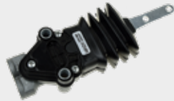
Nivelamento da Cabine