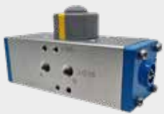
Atuador Rotativo Série WAT