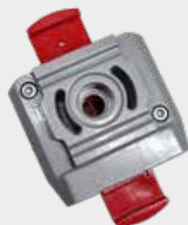
Válvula de Segurança