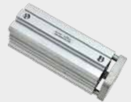
Cilindros Compactos Série CWC