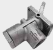
Válvula TIC TAC