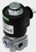
Acionamento da Buzina Trava do Diferencial, Tomada de Força e Reduzida