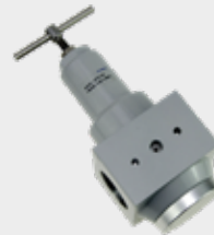
Válvula Reguladora de Alta Pressão