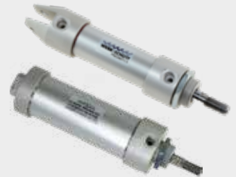
Cilindro Leve Série 1100