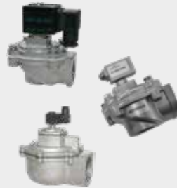
Válvulas de Pulso de Manga