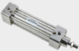
Cilindros Linha Inox - Série CWSS