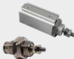
Cilindros Ultracompactos Série WCJP e WCDJP