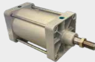
Cilindros ISO Série CWU