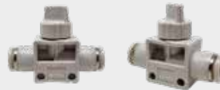
Reguladora de Precisão Série NSHV