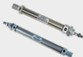
Cilindros ISO Série Mini CWM e CWMI