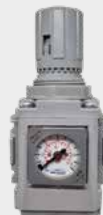
Regulador de Pressão