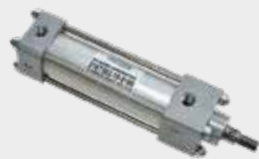
Cilindros Série 2100