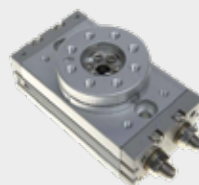
Cilindros Rotativo de Mesa Série CRM