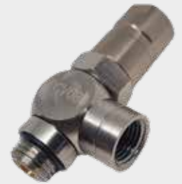
Válvula Retenção Pilotada