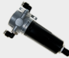
Filtragem do Sistema de Portas