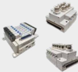
Bloco Manifold Série WVT