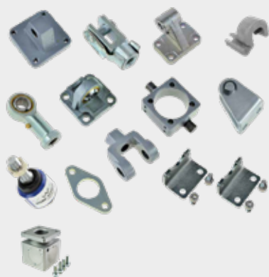
Acessórios Para Cilindros