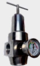
Regulador de Pressão Inox