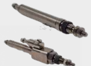
Micro Cilindro Série WCJ1