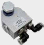
Válvula de Retenção Pilotada