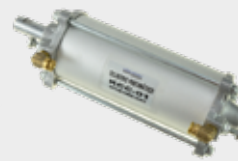
Porta de Ônibus Modelo Caio