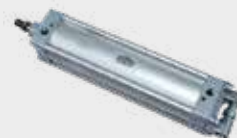
Cilindro Para Amarração de Tora