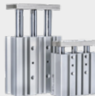
Atuador Pneumático Guiado Série WMGP