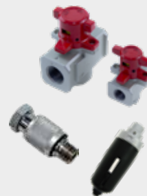
Acessórios para Preparação de Ar