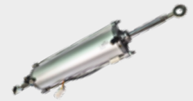
Cilindro Para Sistema de Portas Anti-Esmagamento