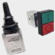
Válvula Alavanca e Válvula Botão Série PDA e PDB