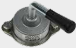
Abertura e Fechamento de Portas