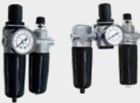
Conjunto de Preparação de Ar