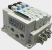
Bloco Manifold c/ Dist. Sinais Conector DB-25