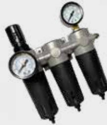
Conjunto industrial de Preparação de Ar