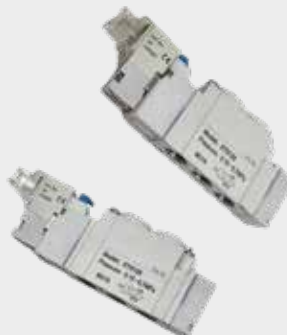
Válvulas Série XY