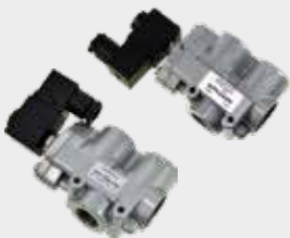
Válvulas Solenóide Poppet (Sorveteira)