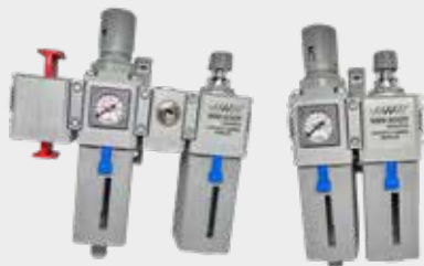
Conjunto Modular de Preparação de Ar Comprimido