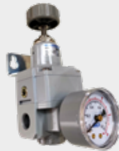
Válvula Reguladora de Precisão