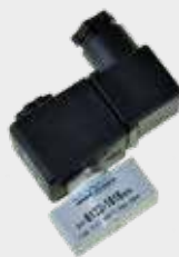
Válvulas mini Solenóide