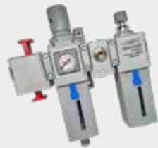
Conjunto Modular de Preparação de Ar