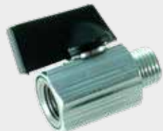
Registro de Esfera Miniatura