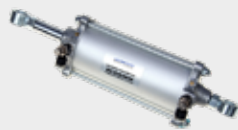
Cilindro de abertura de Porta de Ônibus Modelo Mascarello