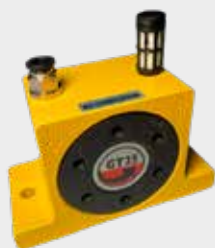
Vibrador Pneumático Turbo