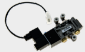
Acionamento de Portas