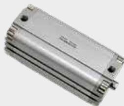
Cilindros Compactos Série CWD