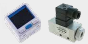
Sensores de Pressão e pressostato