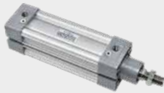
Cilindros ISO Série NCWE