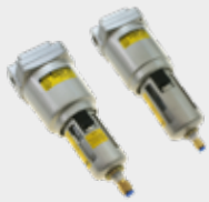
Filtro SAMH e SAMG