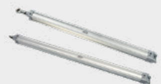
Cilindro Para Asa Delta