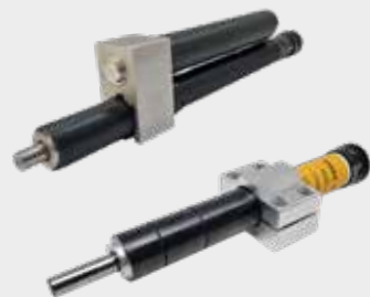
Controlador Hidráulico de velocidade