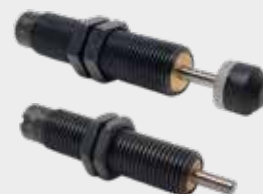
Amortecedores de Choque Série WAD e WAC