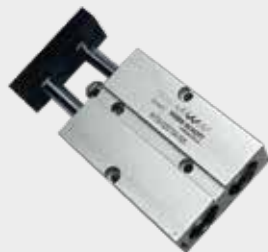
Cilindros Compactos de Êmbolo Duplo Série WTN