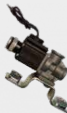
Acionamento de Buzina Tomada de Força e Reduzida