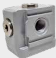
Derivador C/ 4 Saídas