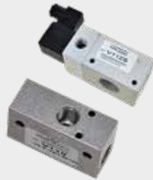
Válvulas Geradoras de Vácuo Série WACV e Série V