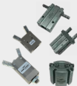
Garras Angulares e Paralelas