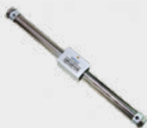
Cilindros S/ Haste Haste de Acoplamento Magnético Série CWR