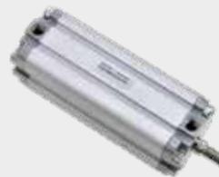
Cilindros Compactos Série CWP