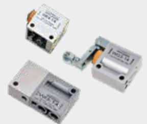
Válvulas Direcionais Poppet