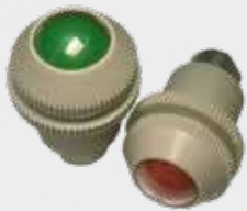
Sinalizador Óptico Pneumático