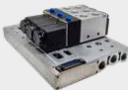
Bloco Manifold DB15