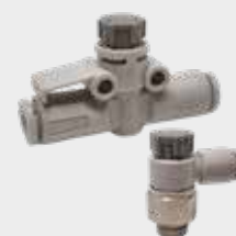
Regulador de Pressão Série NAS